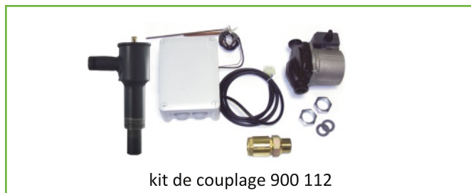
kit de couplage 900 112

Grâce à son dispositif de contrôle, le kit de couplage (réf. 900 112) garantit que les deux chaudières ne fonctionnent pas simultanément. Elles peuvent alors se raccorder dans un conduit de fumées unique . La chaudière à bois est toujours prioritaire. Tant qu'elle est en fonctionnement, la chaudière à granulés est éteinte. Quand la chaudière à bois ne fonctionne plus, la chaudière à granulés prend le relais et démarre automatiquement.