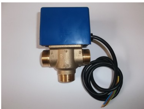
Vanne de zone