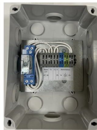
Boitier de raccordement ( relais 12V et bornier)